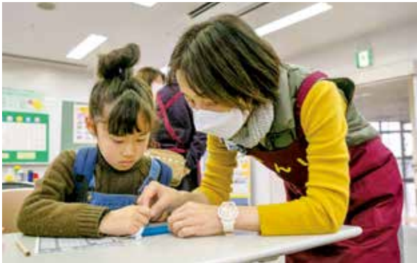
点字体験では自分の名前などを点字で書きました

ふらっと寄り道！見る・聞く・体験～楽しいボランティアあれこれ～は、市内でボランティア活動に取り組む、筑紫野市ボランティアバンクの会と筑紫野市福祉ボランティア連絡協議会が主催したイベントです。それぞれの団体の活動を知ってもらい、一緒に活動する仲間の募集や両団体の連携を強めるために開催されました。参加者は、楽しみながら多様なボランティアの取り組みを体験しました。