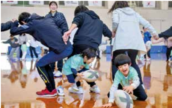
大人の輪の中から子どもたちがボールを持って脱出する遊び

親子が一緒に遊びながら体を動かす楽しさを体験できる「あそびバ!」には、年中から小学校3年生までの子どもとその保護者97組194人が参加しました。このイベントは、近年、子どもたちの体力や運動能力の低下が問題となる中で、楽しく運動能力を向上させることを目的に開催されています。参加者たちは講師と一緒に、さまざまな運動遊びを楽しみました。