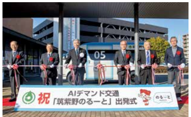
この日以降、新たに3台の「筑紫野のるーと」が稼働しています

最新技術を活用し、地域の暮らしを守る新たな交通手段として山口地域で運行しているAIデマンド交通「筑紫野のるーと」を、西鉄バスの路線廃止・縮小に合わせて山家地域と筑紫・筑紫南地域でも運行を開始しました。「筑紫野のるーと」の利用方法など詳しくは、「広報ちくしの」令和8年1月号や市ホームページでも紹介しています。 ID39725