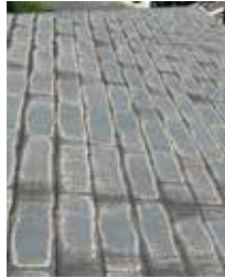
屋根のふき替え工事前