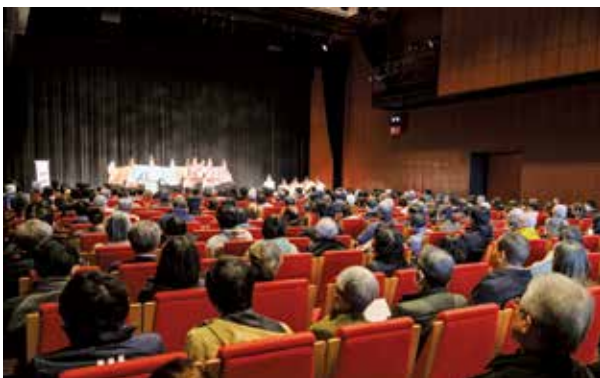
およそ500人の観客と、山家岩戸神楽「四神」を奉納する子どもたち

1月27日(木)から6日間、九州国立博物館で本市の無形民俗文化財「山家岩戸神楽」の展示会があり、最終日には、神楽の特別公演がありました。博物館開館20周年の節目に、地元で守り継がれる文化を知ってもらおうと企画されました。ロビーでは、市の名産品の販売もあり、県内外からの観光客に向けて魅力をアピールしました。