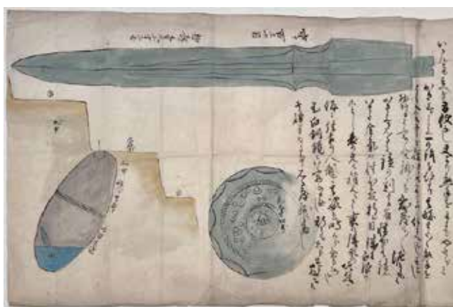
▲鉾之記(挿図部分 筑紫野市歴史博物館所蔵)

写真は、3月に市内で42件目の指定文化財となった古文書「鉾之記(ほこのき)」です。幕末の安政4年(1857年)に、二日市村庄屋