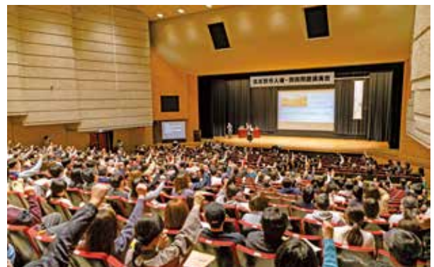
クイズやゲームなどもあり、会場一体となった講演会