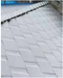
屋根のふき替え工事後