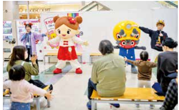
ジャー坊や会場を訪れた多くの人たちと仲良くなりました

市のマスコットキャラクター「つくしちゃん」が大牟田市で開催された「ジャー坊とあそぼう♪」に出演しました。つくしちゃんはジャー坊と一緒に相性占いゲームやダンスをして遊び、会場を盛り上げました。また、会場を訪れた人たちに本市のことをお知らせしたり、一緒に写真撮影を行ったりし、「本市にも遊びに来てくださいね」とアピールしました。