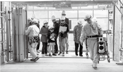
工事用エレベータで6階へ

この見学会は、現在、市庁舎の建設を行っている前田建設・九州建設・久米設計・匠建築特定建設工事共同企業体の主催で、今しか見ることができない建設中の市庁舎を市民の皆さんに公開するために開催されました。