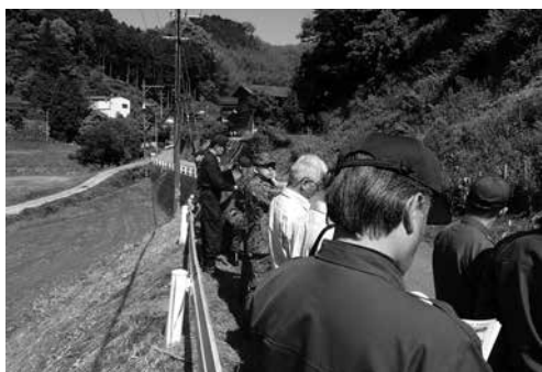
危険箇所を調査する市水防協議会

同協議会では、万が一の場合に万全の態勢をとるため、水防計画を策定し、特に重要水防地域に指定された場所は、関係機関などで絶えず注意が払われています。