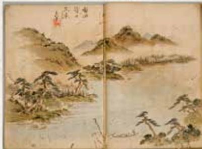
元周が描いた「宝珠山紀行」の挿絵

文久3(1863)年、8月18日、京都で起きた政変による尊攘派公家たちの都落ちが端緒となり、禁門の変―下関戦争―長州征討などの大きな政治事件が相次ぎました。慶応元(1865)年2月、月形洗蔵ら筑前勤