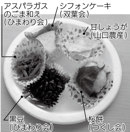
各会の農産物からつくった料理が振る舞われました