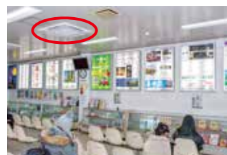
▲空調設備を整備しました

本市へお越しの観光客や、市民が気持ちよく利用できるように、市の玄関口であるJR二日市駅の市民ホールに空調設備を整備しました。