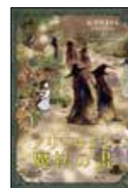
アリーチェと魔法の書