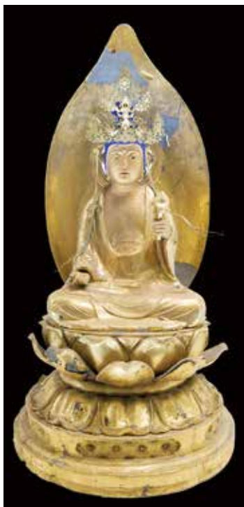
▲柚須原の木造聖観音坐像（もくぞうしょうかんのんざぞう）