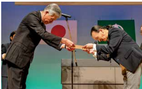
平井市長から感謝状・委嘱状が伝達されました

民生委員・児童委員は「地域の身近な相談相手」として、見守りや相談・支援、地域福祉活動を行うボランティアです。式では、退任する委員に対し感謝状を伝達するとともに、新任・再任となった153人の委員に対し、厚生労働大臣からの委嘱状を伝達しました。民生委員・児童委員の任期は12月1日から3年間です。