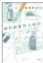
お絵かき禁止の国