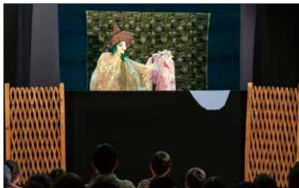
アマチュア劇団むくむくが披露する「ちび魔女」

文化会館でちくしの人形劇まつりを開催しました。プロ・アマチュア合わせて9団体が趣向を凝らした人形劇を披露し、多くの親子がバラエティ豊かな演目に笑ったり驚いたり、心を揺さぶられる時間を過ごしました。参加者たちは人形たちが織りなす世界に引き込まれ、食い入るように見入っていました。