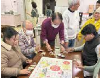
▲日本文化体験(正月・すごろく)

日本語教室「ワイワイ日本語ちくし」では、外国人の皆さんが、日本で生活するのに必要な日常会話や日本文化を学んでいます。スタッフとして一緒に活動しませんか。見学も随時できます。事前にご連絡ください。