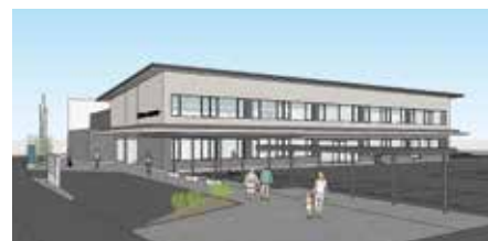
▲旧市役所庁舎跡地に建設予定です

コミュニティ活動拠点施設の整備を行い、コミュニティ活動を推進するため、老朽化した二日市コミュニティセンターの建て替え工事の設計を行いました。