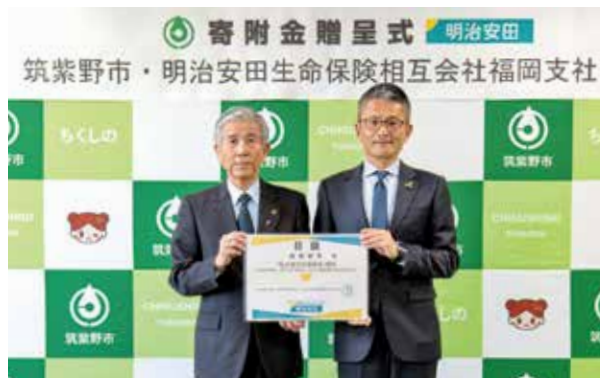
明治安田生命保険相互会社福岡支社から贈呈

明治安田生命保険相互会社では、住民と地域資源のつながりの場を創出し地域活性化をめざす「地域の元気プロジェクト」を実施しています。今回の寄附はその一環で、従業員の皆さんが「私の地元応援募金」として行ったものです。贈呈式では、実績が報告されました。寄附金は住民サービス向上に役立てられます。