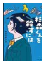
杉森くんを殺すには