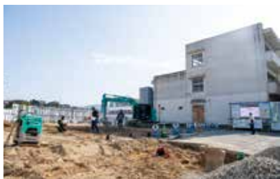
▲増改築を行っている二日市東小学校

また、小学校の特別教室に空調設備を整備し、学習環境の充実を図るとともに、災害時の活用を想定した小中学校の体育館空調設備の整備に向けた調査・設計を行いました。これに基づき、令和8年度中に全小中学校の体育館・武道場に空調設備を整備する予定です。