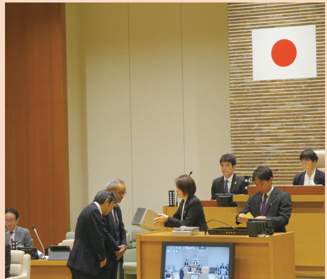
議長選挙の開票の様子

投票は、議場を閉鎖し投票箱や開票作業などを立会人の確認のもと、厳粛な雰囲気の中、実施しました。