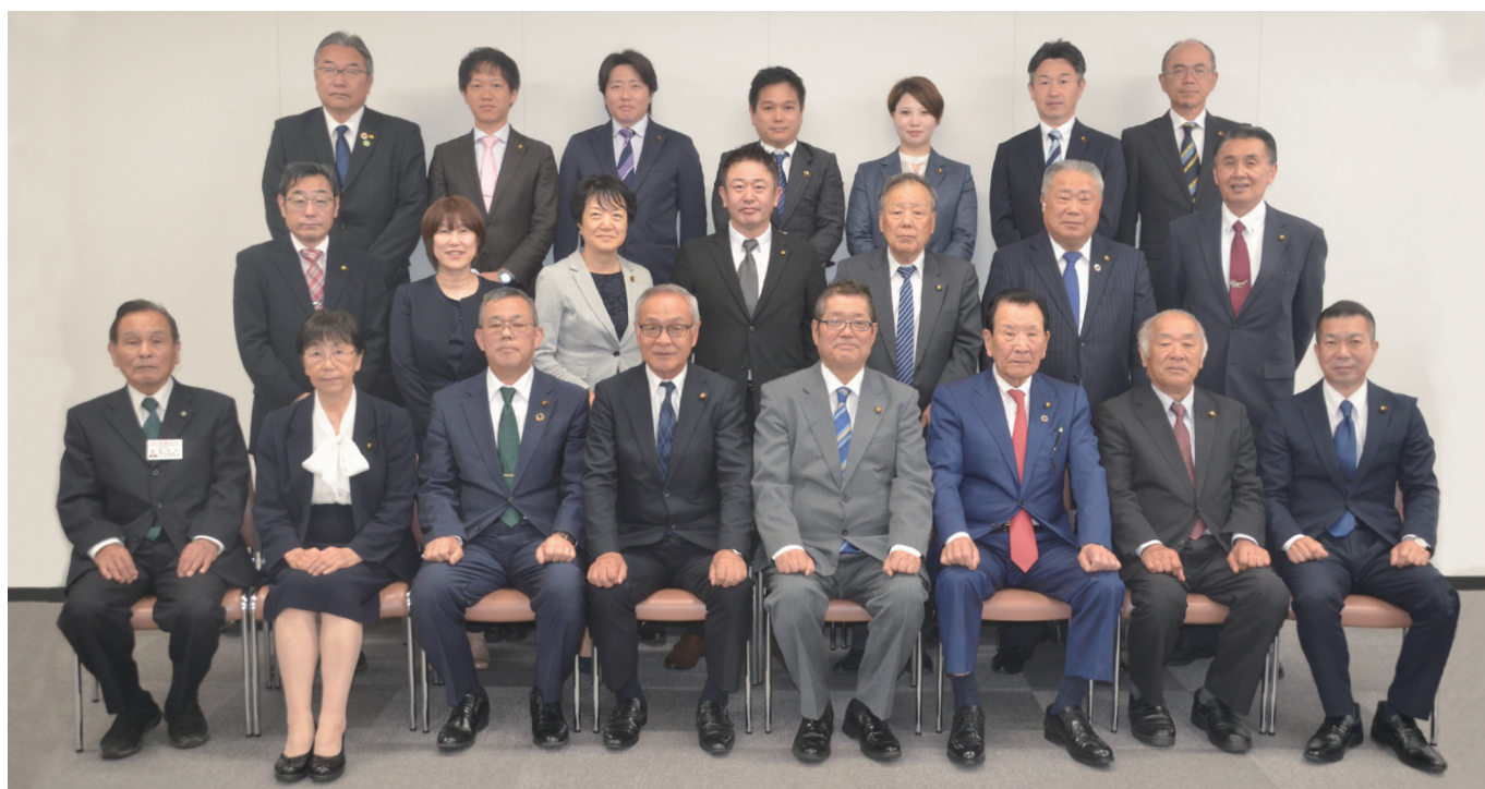
筑紫野市議会議員（任期：令和5年5月25日～令和9年5月24日）