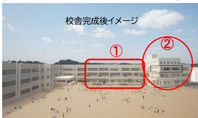
校舎完成後イメージ

今回の工事期間では、増築棟(管理棟北側)・管理棟周辺、また教職員の駐車場として、教室棟1のグラウンド側にも工事囲い・フェンス等を設置しています。グラウンドの使用範囲の制限等ご迷惑をお掛けいたします。 また、工事により発生する騒音等の影響も学校生活に影響が少なくなるよう対策等を徹底し、作業を行います。