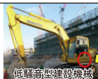
低騒音型建設機械