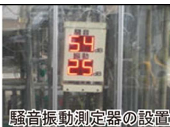
騒音振動測定器の設置