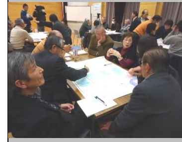
「高齢者支援」は2つのグループに分かれて話し合いました。