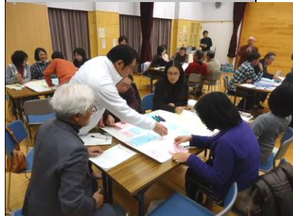
「自然・街並み・環境・歴史」は2つのグループに分かれて話し合いました。