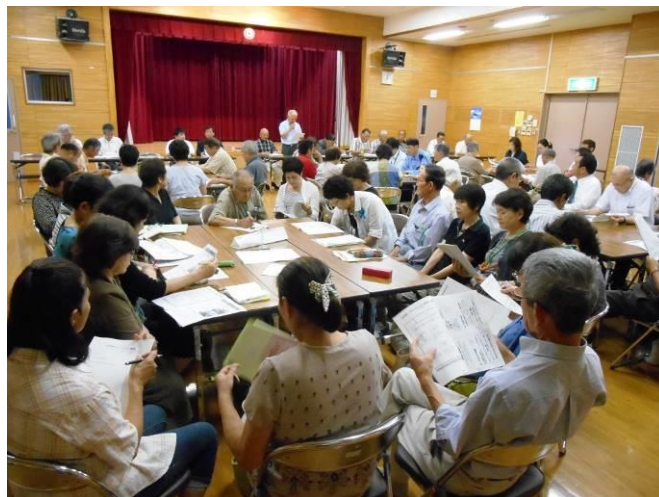
（8 月 6 日報告会の様子）

そして、総会の代議員も選出され、いよいよ「山口コミュニティ運営協議会」の設立を迎えることとなりました。