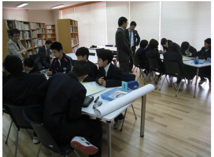
二日市中学校でのワークショップの様子

「こんなまちになったらいいな」「こんなまちにしたい」、子ども達ならではの視点、また大人と同じような視点から、これからのまちの姿について一生懸命に話し合いました。