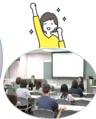
《講師 ハローワーク福岡南 マザーズコーナー就職支援ナビゲーター》