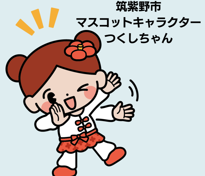
筑紫野市 マスコットキャラクター つくしちゃん