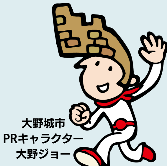
大野城市 PRキャラクター 大野ジョー