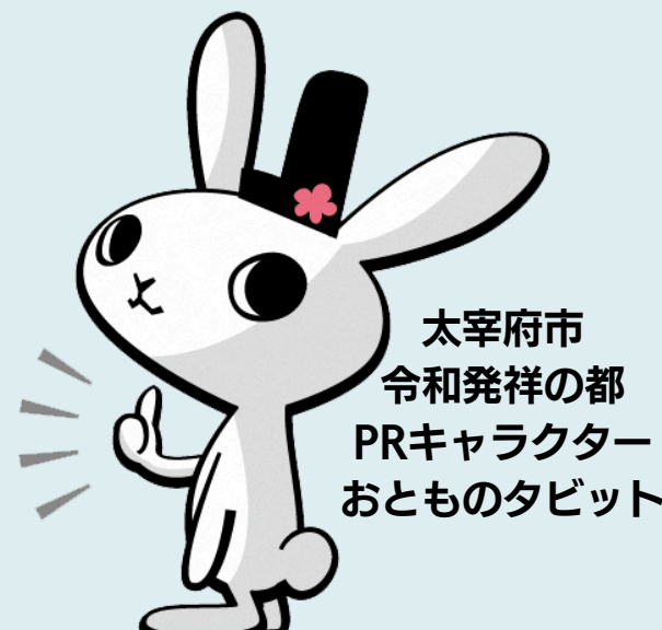
太宰府市 令和発祥の都 PRキャラクター おとものタビット