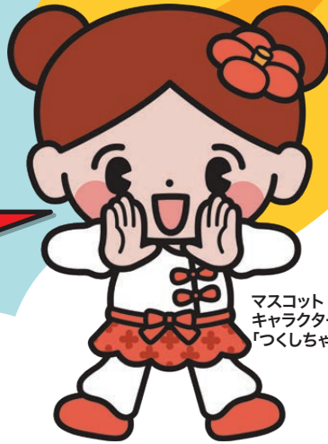
マスコット キャラクター 「つくしちゃん」

※ただし、応募多数の場合は、7月販売の第1弾で 落選された方を優先させていただきます。