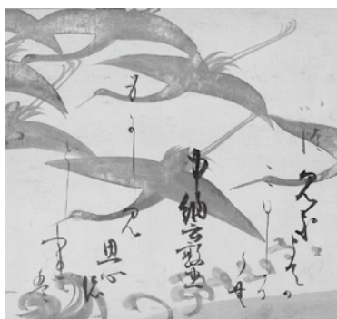
▲重要文化財「鶴下絵三十六歌仙和歌巻(部分)」作者 本阿弥光悦筆・依屋宗達画、時代 江戸時代・17世紀、所蔵 京都国立博物館、展示期間 3月20日～4月8日

王羲之直筆の書は見つかっていませんが、文字の輪郭を極細の筆で薄い紙に写し取る「搨摸(とうも)」などの精密な複製が残っています。今回の特別展では、王羲之を源泉とする日本の書の流れをご紹介します。ぜひ書の魅力を感じていただきたいと思います。