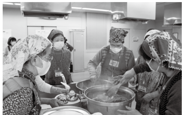
しょうがのつくだ煮を炊き立てのご飯に混ぜ合わせました

皆さんで試食した後は、意見交換を行いました。参加者からは「家でも作ってみたいと思った」「昔懐かしい料理を作ることができてうれしかった」「生産者の顔と食材が見えて、それが一致したので、今日の参加は有意義な機会だった」などの感想があり、地産地消や地域の食文化への思いを交流し合うことができました。（今回作ったレシピは市ホームページに掲載しています）