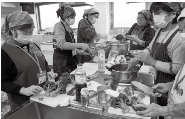
ブロッコリーは切らずにそのままゆでるのがいいそうです

このイベントは、生産者と消費者が一緒に料理をすることで、地元農産物の美味しさを知ってもらい、地域の食文化を育むことが目的です。農産物の特徴や調理のこつを聞きながら、がめ煮や白ねぎのドレッシングあえ、