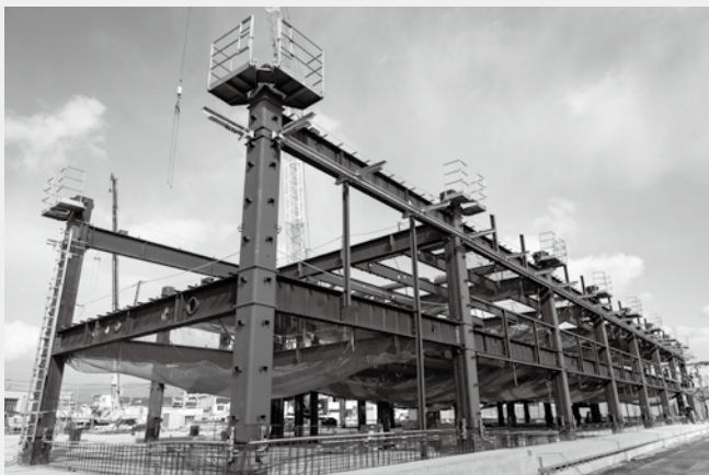
3階の床までの鉄骨を組み上げています。(JR鹿児島本線側から1月25日撮影)

建物を支える鉄骨を組んでいます 建物の基礎部分から柱一本の全長は、鉄の柱と梁(はり)でできています。 鉄骨は、建物を支える「骨格」であり、鉄骨工事をしています。 1階の床のコンクリート工事が1月中旬に完了し、鉄骨工事をしています。 鉄骨は、建物を支える「骨格」であり、鉄骨工事をしています。 3階の床までの鉄骨工事をしています。 鉄骨工事が完了すると、地上6階建ての庁舎の大きさが分かるようになります。 屋上まで約32メートルあり、4分割で組み立てます。現在、3階の床までの鉄骨工事をしています。