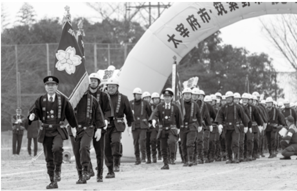
筑紫野市消防団による分列行進

筑紫野市消防団からは、8月に行われた第3回福岡県女性消防操法大会で3位入賞を果たした女性班が軽可搬ポンプ操法を披露しました。消防本部は消防団と連携した演習を披露し、来場した人たちは機敏な救助活動を熱心に見ていました。