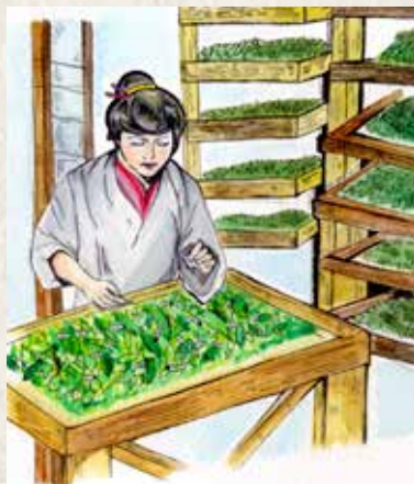
蚕棚の前で蚕を育てるようす

現在、歴史博物館では、冬の企画展「昔のくらし」展を開催中です。本展では、養蚕に使われた道具をはじめ、農業や山仕事の道具・大正から昭和時代にかけての生活用品を展示しています。「仕事」というテーマを焦点に、市民の皆さんから提供していただいたさまざまな民具をご紹介します。ぜひ、ご覧ください。