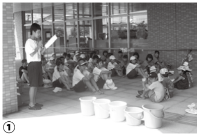
ボランティア活動のようす

○申し込み方法 電話で、①氏名、②学校名・学年、③住所、④電話番号を下記までお知らせください。