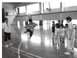
【あしきっこ子ども広場のようす】 左：読み聞かせ、右：ゴムとび