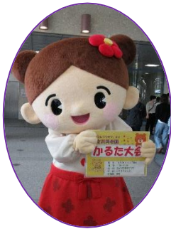
リニューアルした ちくしちゃん

秋の恒例イベント「パープルプラザフェスタ」が開催されました。パープルプラザを拠点に活動している団体・サークルの皆さんの学習成果発表・活動紹介、さまざまな体験学習などのイベントを通して市民の皆さんとの交流をはかりました。男女共同参画プラザ活動登録団体連絡会からは、今年も男女共同参画かるた大会・パネル展示で参加しました。