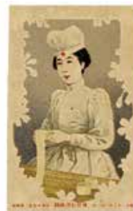
▲包帯を手にする赤十字の看護婦