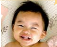
そう い お 宗 依桜ちゃん(1歳)