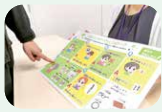
指差して思いを伝える コミュニケーションボード

市では、手話通訳以外にもさまざまな形で障がいのある人のコミュニケーションをサポートしています。