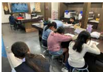
▲各自で課題に取り組んでいます

一つめは、個人の店舗の一部を毎日開放して、放課後に子どもたちが宿題をしたり、用意した課題に取り組んだりしている居場所です。始めて6年が経ちました。中には中高生になってもやってくる子どももいます。