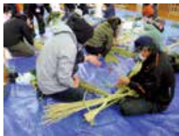
▲しめ飾り作りのようす