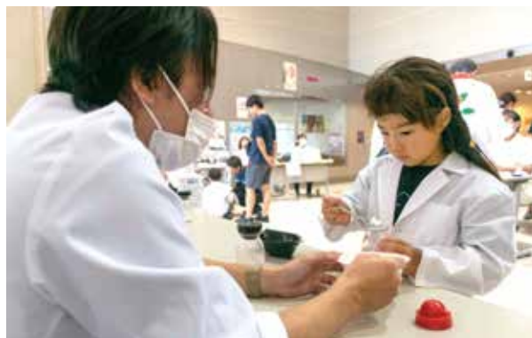
子どもたちに大人気の薬剤師体験

健康と福祉をテーマにカミーリヤフェスティバルを開催しました。イベントには子どもから大人まで幅広い年代の人が参加し、ボランティア団体によるバザーや点字体験、アイマスク体験などで福祉の大切さについて身をもって学ぶ機会となりました。また、ウォーキングイベントや骨密度測定などで自身の健康について考え直すきっかけとなりました。