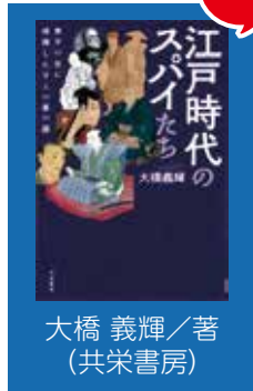
大橋 義輝/著 (共栄書房)

本書を通して、写楽、広重、伊能、芭蕉が活躍した時代に思いをはせてみてはいかがでしょうか。