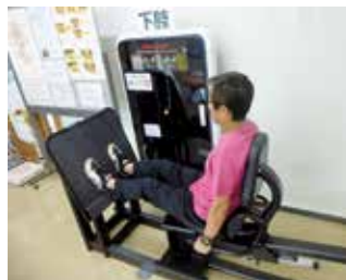
▲設置したレッグプレス&カーフレイズ

問 日 日時・期間 問 場 場所 問 対 対象 問 内 内容 問 定 定員 問 料 料金 問 持 持参物 問 締 締切 問 申 申し込み先 問 ID 市ホームページの記事ID