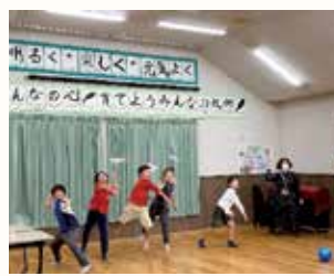
▲よく飛ぶ折り紙ヒコーキに挑戦

一つめは、個人の店舗の一部を毎日開放して、放課後に子どもたちが宿題をしたり、用意した課題に取り組んだりしている居場所です。始めて6年が経ちました。中には中高生になってもやってくる子どももいます。