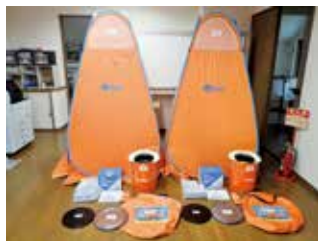
▲整備された防災備品

自治総合センターによる令和6年度自主防災組織育成事業で採択され、都坂防災くらぶの団地内の防災活