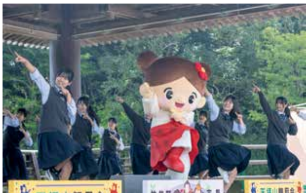
お披露目した新しいつくしちゃん

90回目となる観月会では、恒例となりつつある九州プロレスの試合やお笑い芸人ブルーリバーの漫才が披露され、他にも新しく生まれかわったつくしちゃんのお披露目や、飲食や体験型のブースなどの出店がありました。あいにくの曇り空で満月は見るできませんでしたでしたが、5年ぶりに復活した花火が夜空を彩り、昼から夜まで楽しさ満点の観月会となりました。