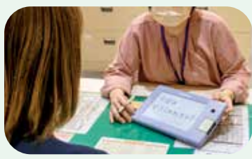
窓口では筆談用の ボードを準備