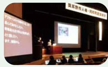
人権・同和問題講演会での 講演の要約筆記