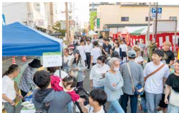
日が暮れた後も活気は続きました

復活から3年目を迎える今年も、二日市商店街で土曜夜市が開催されました。このイベントには実行委員会の皆さんの「子どもたちに二日市ならではの思い出を作りたい」という願いが込められています。ステージ発表や出店、大人気のカレー食べ比べなど、多彩なイベントでにぎわう商店街で、食べて遊んで楽しい一夜となりました。