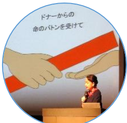
ドナーからの命のバトンを受けて 臓器移植とは、命をつなぐこと

「臓器移植について家族で考えるきっかけとなった」「臓器移植は救命救急の延長線上にあるという言葉が印象的だった」「命の尊さ、健康の有難さを改めて感じた」などの感想を頂きました。夏休み期間中の開催のため、小学生の参加も多く、穏やかなピアノ演奏に心癒される時間となりました。