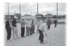
スポーツ交流会のようす