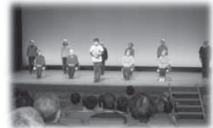
(健康レクササイズ)