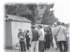
館外学習のようす

☆平成24年度「ちくしの高年大学」の募集についての詳細は、「広報ちくしの3月15日号」でお知らせします。