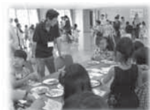
社会参加活動のようす