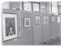
昨年の作品展のようす