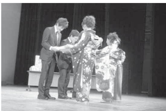
昨年開催時の様子