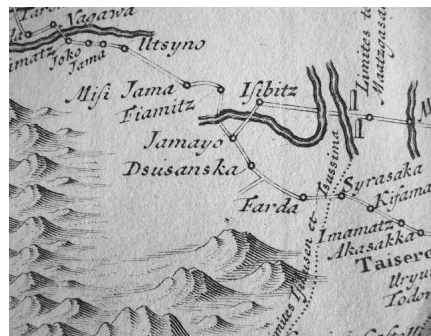
●ケンペル「長崎街道図」 Jamayo(山家)、Farda(原田)の文字がみえます。

●薬袋 江戸時代後期に作られた薬袋。西洋人の姿が描かれ、「きなきなぐわん(キニーネのことか?)」「筑前原田松屋製」と書かれています。