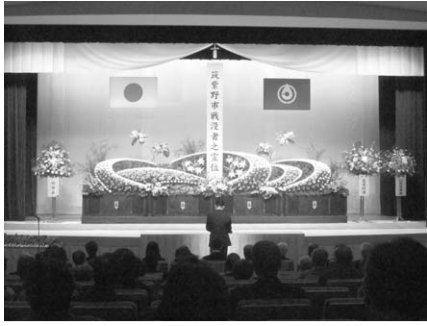
昨年の追悼式の様子