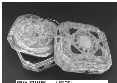
海外初出品 「鏡箱」 (トルキ山古墳出土、10世紀、内蒙古文物考古研究所蔵)

※本講座は九州国立博物館で開催している特別展「草原の王朝 契丹―美しき3人のプリンセス」の解説講座です。特別展は九州国立博物館にて開催しています。