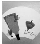
【作品例】 正月飾り(ちぎり絵)

※筑紫・筑紫南は筑紫地区文化祭(会場：筑紫南コミュニティセンター)に参加のため、定例学習会はお休みです。