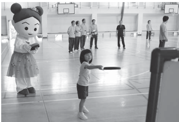
柔らかいディスクを投げてパネルを落とすディスクッター

初めて体験するスポーツも、スポーツ推進員の皆さんの丁寧な手ほどきによって、すぐに楽しむことができました。