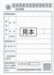
▲後期高齢者医療被保険者証

7月31日までに新しい被保険者証(柿色)が届かない場合は、お問い合わせください。