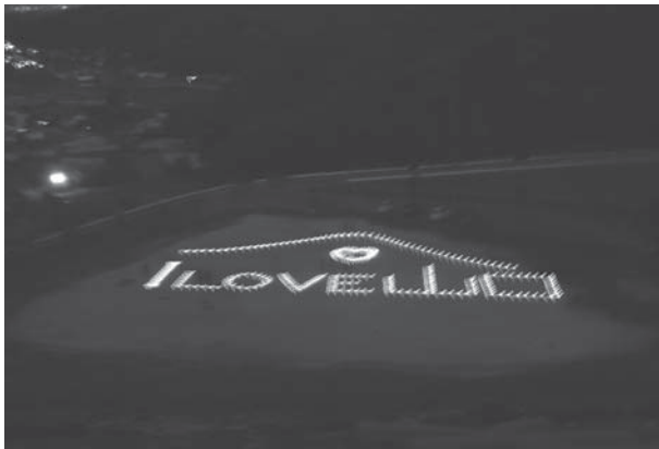
参加者の皆さんで設置したキャンドルが浮かび上がりました