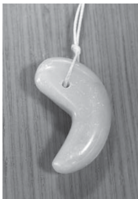
講座でつくる勾玉(見本)