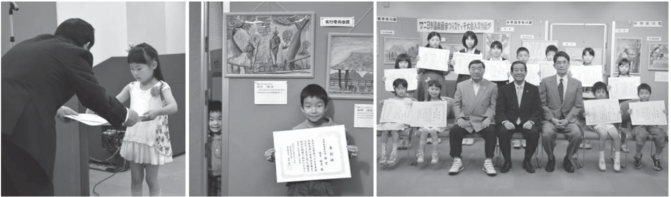
6月20日(土)に入賞者表彰式を行いました