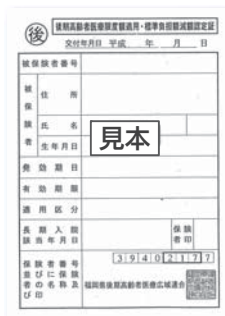
▲後期高齢者医療限度額適用・標準負担額減額認定証

減額認定証をすでに持っている人で、平成27年度の市町村民税が非課税世帯の人には、8月1日からの新しい減額認定証を被保険者証とは別に7月下旬にお届けします。