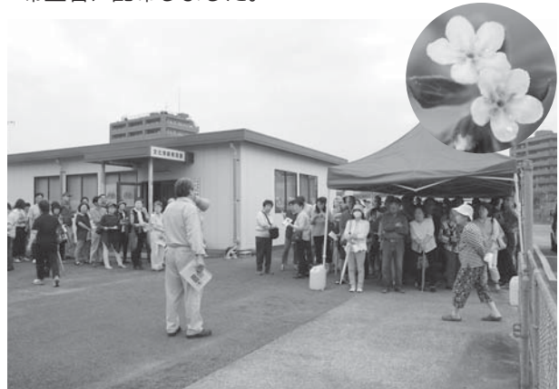
多くの人の参加があった配布会と、紫草の白く可憐な花(右上)