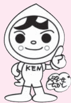
人権イメージキャラクター「KENまる君」