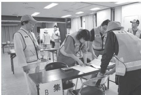
安否を登録台帳で確認