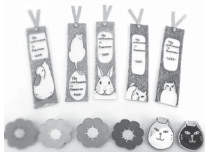
作品例 (上：しおり、下：ブローチ)

◆申し込み方法 延期募集につき、電話で受け付けます。 生涯学習課 ☎(918)3535まで。