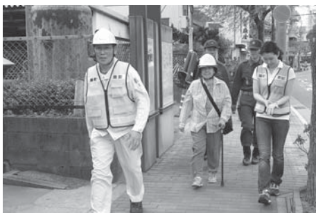
災害時要援護者を訪問し、公民館に避難する