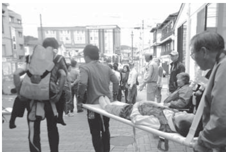
担架や車イスなどで実際に避難できるか確認

防災や防犯のために必要な備品などについては、「防災・防犯備品資材」として、いざというときにすぐに使えるように資材倉庫の中に整理・保管しており、在庫などを定期的に点検しています。発電機は、夏祭りなどの区の行事があるときに使用して動作を確認したり、女性にも操作してもらえよう講習を行っています。