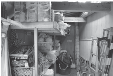
必要な備品を整理している防災防犯資材倉庫

湯町区では、防災防犯委員会を組織し、「自分たちの地域は、自分たちで守ろう」というテーマに、独自の防災訓練、危険箇所調査、災害時要援護者支援などに取り組んでいます。