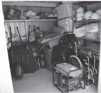
車イス、リヤカー、発電機などを備えた防災庫