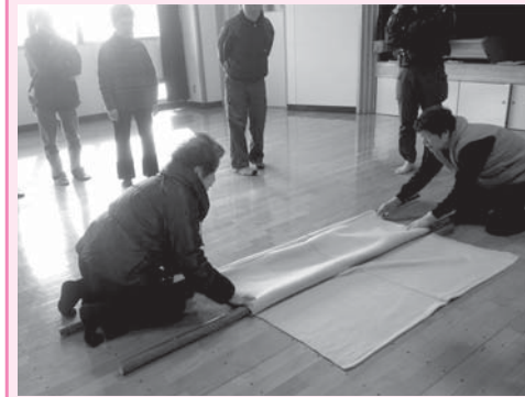
毛布を使った簡易担架の作り方の講習