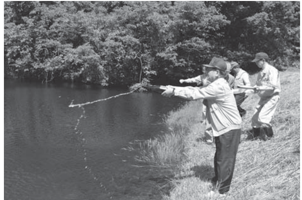
練富士池で祈願を行いました

現在、市内の水がめである水呑ダム、山神ダムはほぼ満水状態ですが、これから夏場に向けて、水の使用量が増えることから、市民の皆さんには節水をお願いします。