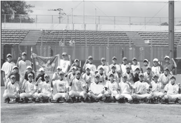
優勝を飾った筑紫野南中学校野球部の皆さん

天候が心配されましたが、2日目は快晴となり、照りつける日差しの中、選手一人ひとりが全力で白球を追っていました。