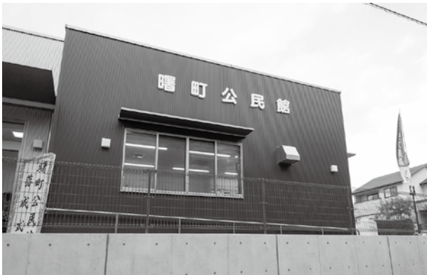
新しく生まれ変わった曙町公民館

曙町区の皆さんは、平成26年から建設準備会を立ち上げ、建築・設計事業者と16回にわたる工程会議を重ねてきました。新しい公民館は、敷地は変わらず以前よりも約3割広く、駐車場から直接入れるなどバリアフリーとなっており、多くの人の活用が期待されます。