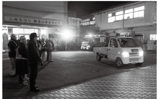
市役所では二日市小学校区の出発式が行われました

冬季は暗くなるのが早く、より一層の注意が必要です。いま一度防犯・防災対策を振り返ってみましょう。