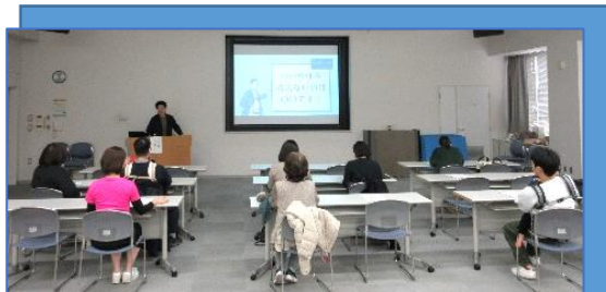
パパママ世代だけでなく、幅広い対象者が受講されました。

育休を約2年取得し、「パパ育休の良さを伝えたい。パパ育休の上手な活用によりママの育児負担を減らせるかも」との思いから自ら団体を設立した講師に、パパ育休の体験談等を聞きました。職場の理解、収入面の不安などパパ育休の取得には、まだまだハードルが高いのが現状ですが、パパ育休の取得により、夫婦が一緒に育児のスタートラインに立つことで絆が深まります。今後、社会や個人の意識変化により、パパ育休を取得しやすい環境となることを願います。