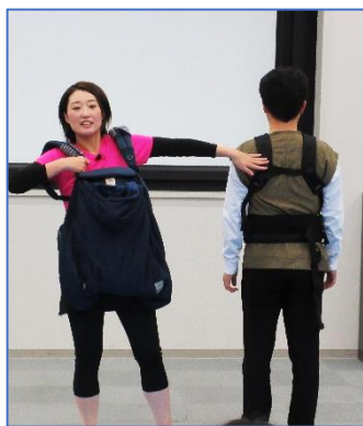
意外と知らないだっこ紐の正しいつけ方

「元競技ダンサー」の経歴を持つ講師から、だっこ紐で赤ちゃんをだっこしながらステップを踏むベビーダンスを学びました。だっこ紐の正しい付け方を学んだ後、曲に合わせて、ステップを踏むとスヤスヤと寝てしまう赤ちゃんが続出！！「子どもと触れ合う貴重な時間でした」「寝かしつけに取り入れます」との感想を頂きました。