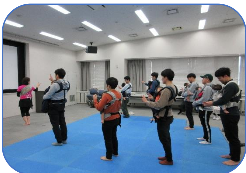
パパと赤ちゃんで楽しくダンス。 親子の絆を深める楽しい機会となりました。