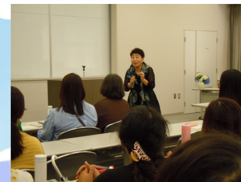
人気講師による子育て講座