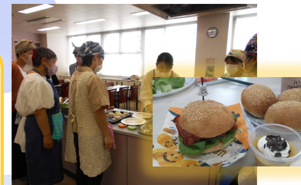
パン作り講座でリフレッシュ！