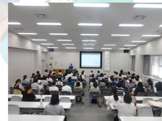
どなたでも参加できる公開講座