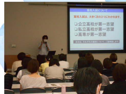
最新の受験情報と勉強会