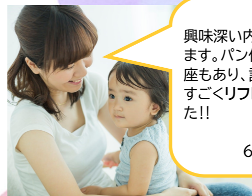
就学前のお子さんを持つ保護者様対象

興味深い内容の講座があります。パン作りなど楽しい講座もあり、託児もあるので、すぐリフレッシュできました!!