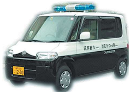
つくしライオンズクラブの45周年を記念して市に寄贈された防犯パトロール車

筑紫野市地域防犯活動推進団体に認定された団体の構成員、防犯指導員、青少年指導員、少年補導員など ※「筑紫野市防犯協力員」の登録と、警察の行うパトロール実施者研修の受講が必要です。