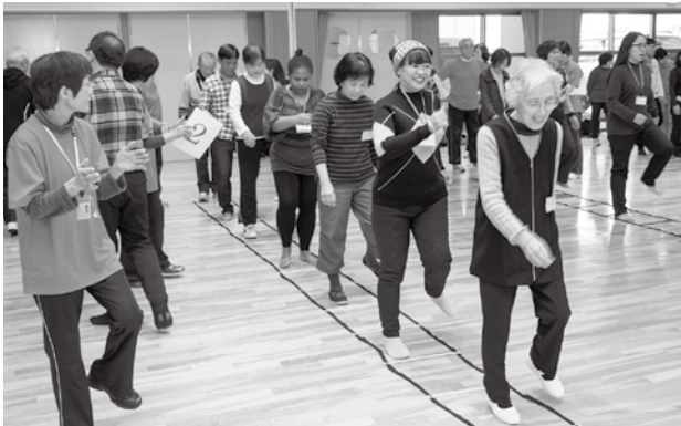
慣れない動きに戸惑いながらも楽しく行った「ラダートレーニング」

コミュニティトレーナーの皆さんは、地域型健康づくり講座「ふれあいスポレク」(筑紫コミュニティセンター)に参加し、脳トレやストレッチ体操、ロコモ体操、レクリエーションなどを講座参加者や運動サポーターと一緒に