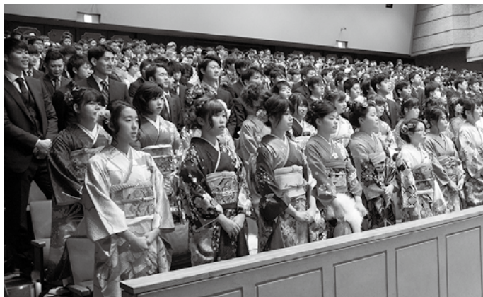
昨年の成人式の様子

☎(918)3535 / FAX(923)0416 / 電子メール k-gakushuu@city.chikushino.fukuoka.jp