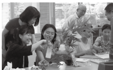
写真上: 少人数のグループにわかれての学習風景 下: 日本文化紹介イベント(七夕)の様子

【筑紫野市日本語教室実施内容】 ●日時 月4回火曜日(第5週と祝日は休み) 10時～12時※いつからでも参加できます ●場所 生涯学習センター(市内二日市南1-9-3) ●対象 市内および近郊の日本語を学習したい外国人 ●参加費 1回100円 ●問い合わせ先 生涯学習課 ☎(918)3535(代表)