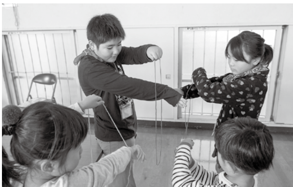
「ひもあそび」の手品を丁寧に教える子ども会リーダー

各ブースでは自由に子どもたちが遊び、子ども会リーダーたちは初めての子にも分かるように遊び方を丁寧に教え、楽しい笑顔であふれていました。