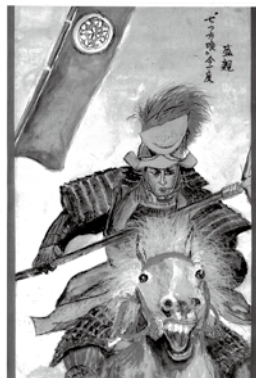
【画・字】今長谷 照子

前回のテーマ「長宗我部元親」に続き、1月と3月は2回に渡り、息子の「長宗我部盛親」を取り上げます。