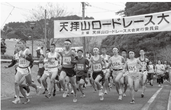
10kmの部が一斉にスタート

開催当日は天候もよく、ランナーたちは練習の成果を発揮しようと懸命に走っていました。