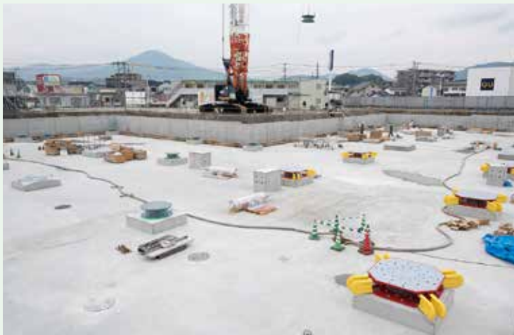
コンクリートの土台の上に免震装置を設置しました

建物を地震からまもる 免震装置の設置を完了 災害発生時には、対応の拠点となる市庁舎。庁舎棟の地下に免震装置を48力所設置します。免震装置は4種類を組み合わせ、大地震に対しても被害を最小限に抑え、庁舎機能を維持することができ ます。 市庁舎を支える柱の下に免震装置を設置するため、コンクリートの土台の上の一つ一つの土台に取り付けています。