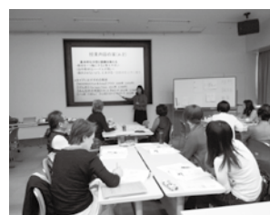
昨年のスキルアップ講座の様子