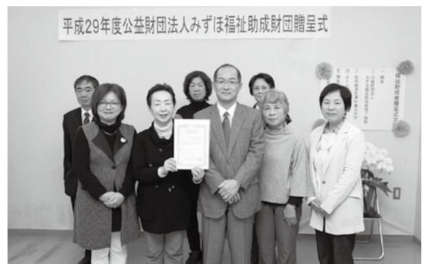
平成29年度公益財団法人みずほ福祉助成財団贈呈式

助成により、老朽化したカセットテープダビング機を新たに購入するさくら会の皆さんは「これからは安心して音訳テープのダビングができます。大切に使いたいですね」と笑顔で話していました。