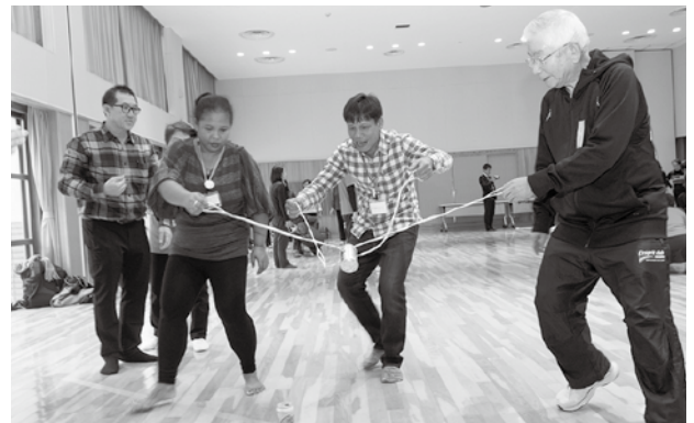
一緒に行ったレクリエーション。空き缶を運ぶ「カントリーゲーム」

視察したコミュニティトレーナーは「元気な筑紫野市のサポーターの皆さんを手本として、タイを元気にできるように頑張りたい」と話していました。