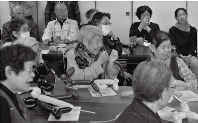
「笑顔お届け隊」の活動のようす（11月17日 六反公民館）

「ちくしの高年大学」(※)では9月から翌年1月の期間、「ボランティア実践講習会」を行い、「ものづくり」、「手品」、「レクリエーション」などに分かれて学習しています。その学習成果を、みなさんの地域の公民館いきいきサロンなどを中心に、「笑顔お届け隊」と銘打って、披露しています。