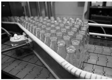
3 工場でサイダー製造スタート！