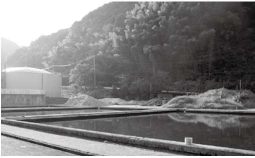
山口浄水場 (大字山口2066)