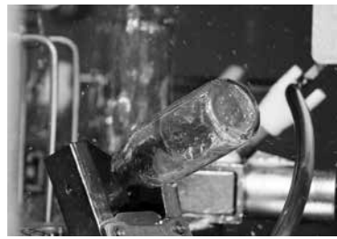
4 ビンを洗浄します