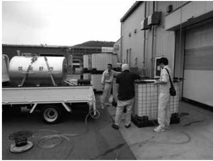
2 佐賀県小城市の工場に水を運ぶ