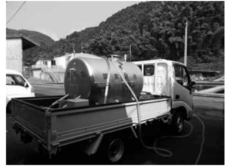
1 山口浄水場からサイダーに使用する水を取水