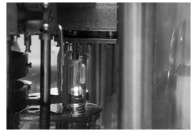
5 ビンにサイダーを充填します