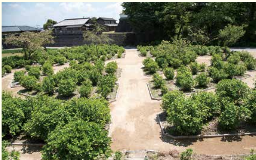
園内で自由にアジサイを観賞できるよう、園路を整備しました

6月10日（土）には開園式が行われる予定です。初夏の天拝公園に出かけてみませんか。