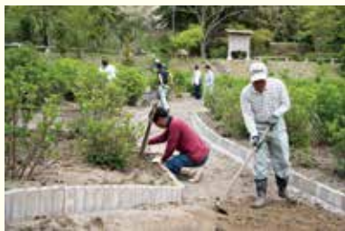
筑紫野経済同友会、筑紫野市議会、筑紫野市商工会、筑紫野市観光協会など、多くの皆さんの協力のもと、草刈りやレンガ設置が行われました