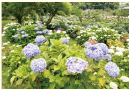
6月上旬には見頃を迎えます（昨年の様子）