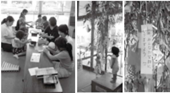
昨年の「七夕まつり」のようす