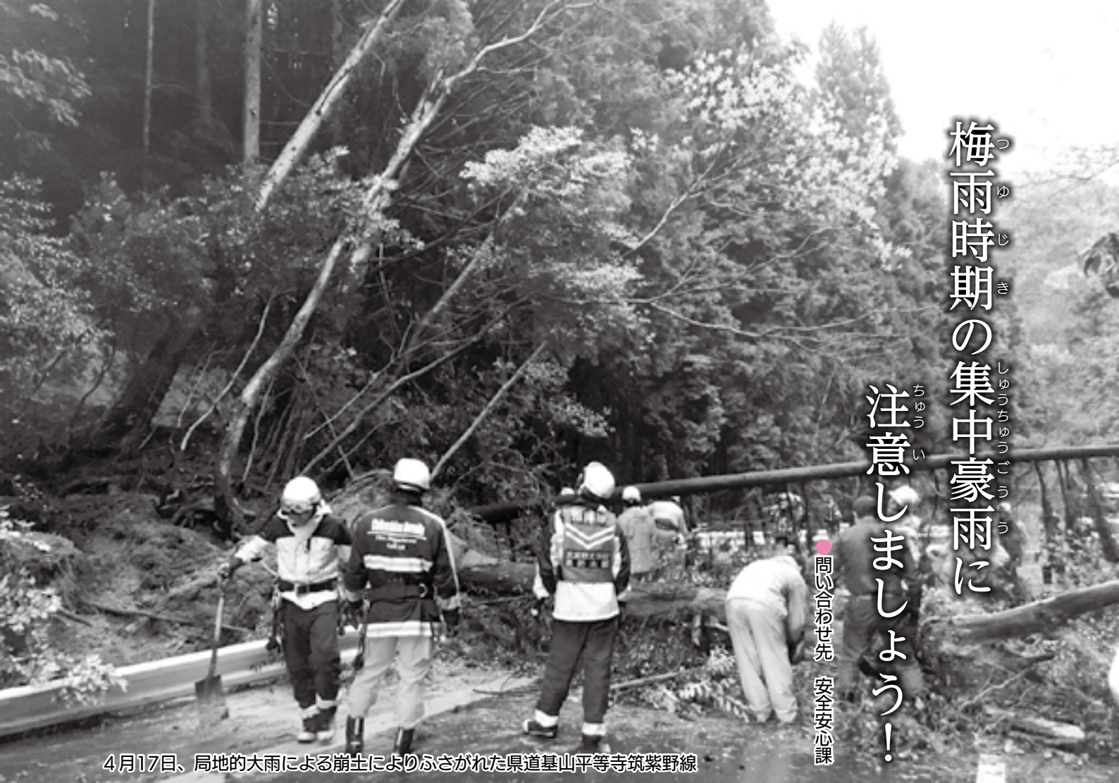
4月17日、局地的大雨による崩土によりふさがれた県道基山平等寺筑紫野線