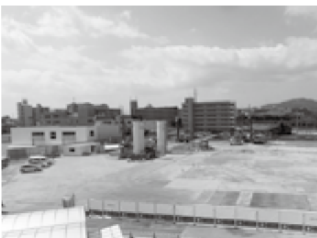
地盤改良工事を行っています