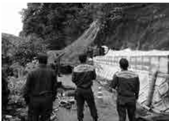
危険箇所を調査する市水防協議会

同協議会では、万が二の場合に万全の態勢をとるため、水防計画を策定し、特に重要水防地域に指定された場所は、関係機関などで絶えず注意が払われています。