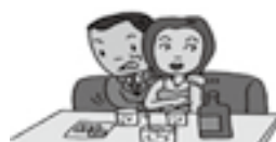
不法就労・不法滞在

皆さんの周りでこのような犯罪の情報があれば、最寄りの交番や警察署に情報提供をお願いします。