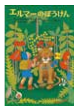
エルマーのぼうけん