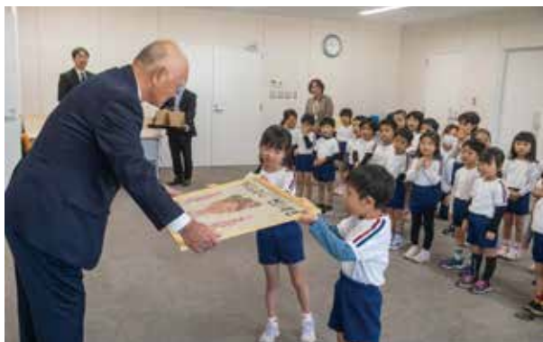
感謝の思いがこもったちぎり絵をいただきました