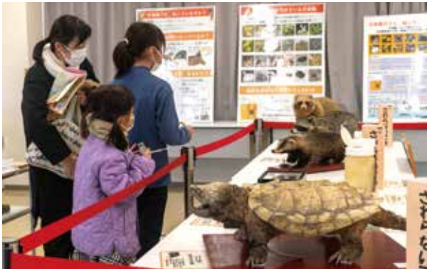
剥製で外来生物の特徴を学びます

今年度は外来生物の剥製を用意。迫力のある剥製に来場者は興味津々で見入っていました。