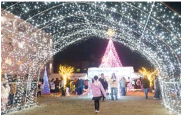
中央通り商店街会場の光のアーチ

イルミネーションは、二日市中央通り商店街とJR二日市駅東口で、1月26日まで点灯しています。