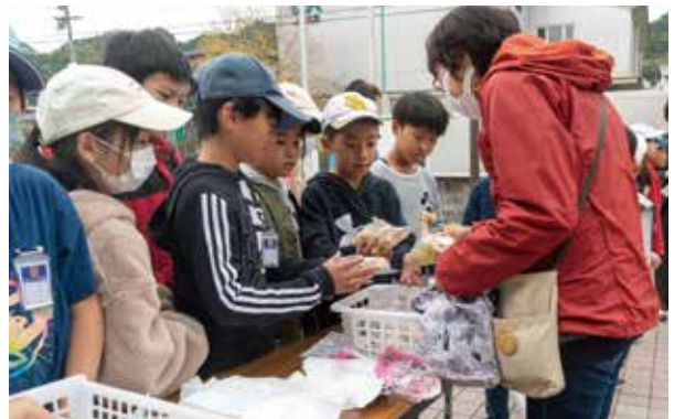
手書きのラベルの生姜は心も温めてくれます

山口の特産品を多くの人に知ってもらおうと、山口小学校4年生の児童が自分たちで育てた生姜の販売を行いました。生姜は山口コミュニティセンターでの買い物支援事業にあわせて販売され、児童たちは生姜150袋の一つ一つに手書きのラベルを作成。山口の生姜の魅力や調理方法などを紹介した手作りのチラシもあわせて配布し、生姜は40分で完売となりました。