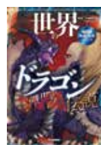
世界のドラゴン伝説