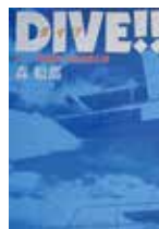
DIVE!! (ダイブ) 1

苦しみながらも、仲間たちと切磋琢磨(せつさたくま)しながら競技に向き合う姿はとてもまぶしく心揺さぶられる思いがします。筑紫野市電子図書館でも読むことができます。今年最初の1冊にいかがでしょうか？