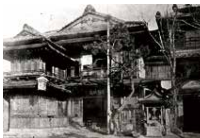
▲明治35年ごろの武蔵温泉(薬師湯)