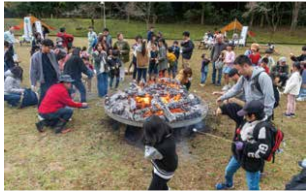
適度なあぶりが難しくも楽しい焼きマシュマロ体験

竜岩自然の家でドラゴンロックフェスタを開催し、多くの人でにぎわいました。会場では、火おしや丸太切り、リースづくりや竹細工づくりなどさまざまな体験ができ、子どもも大人も一緒に楽しんでいました。キャンプファイヤーを囲んでの焼きマシュマロ体験では、上手に焼けた人も少し焦がしてしまった人も、笑顔でおいしそうに食べていました。