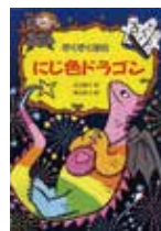
ぞくぞく村のにじ色ドラゴン