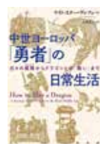
中世ヨーロッパ「勇者」の日常生活