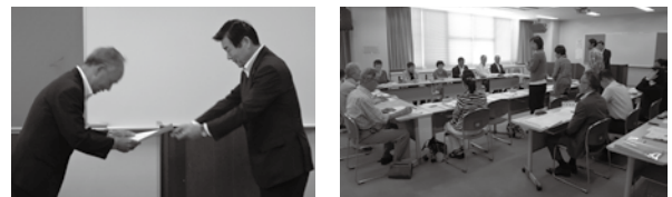
左：上野教育長から稲住委員に委嘱書を交付 右：会議の様子