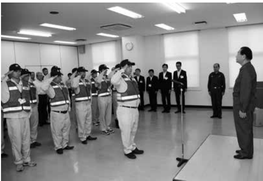
当初派遣する14人に対し7月13日に出発式を行いました

今後も引き続き被災地の情報収集に努め、要請があった場合には支援を行ってまいります。