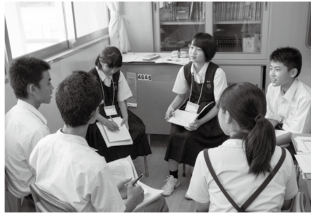
意見を交換し合う五中学校の生徒会の皆さん