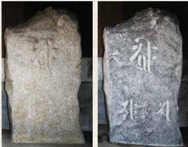
岡田の阿弥陀三尊板碑(右は拓本を取ったもの)