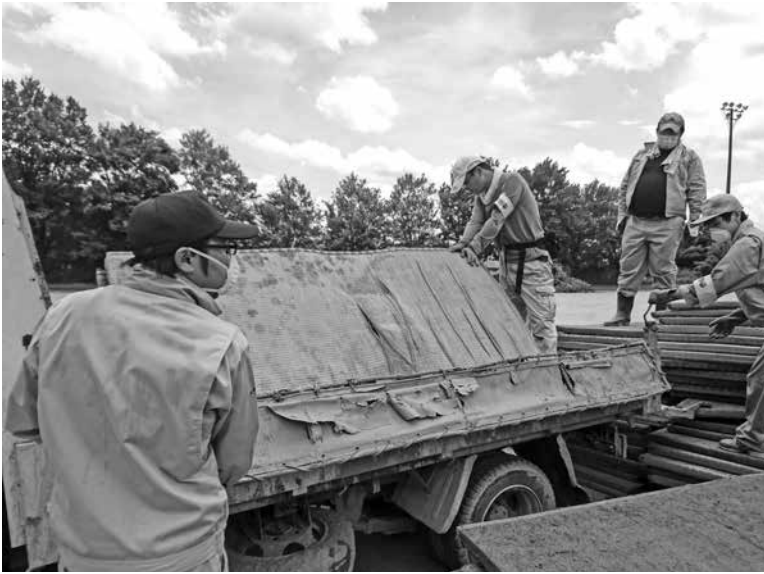
被災した家屋から運び込まれた畳を協力して降ろす市職員(左)(朝倉市にて)