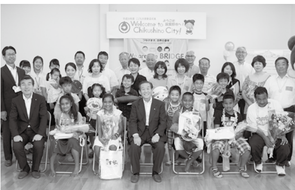
地域の人や通訳を担った筑紫高等学校の生徒さんたちと一緒に

こども大使たちとホストファミリーとの対面時は、お互い少し照れくさそうでしたが、9日間を共に過ごし、阿志岐小学校への2日間の登校体験などを行いながら、言葉の壁を乗り越え交流を深めました。