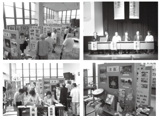
昨年の推進大会のようす

◆対象 公民館関係者、社会教育関係者、地域コミュニティに関心のある人など、どなたでも