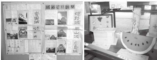
昨年の作品展のようす