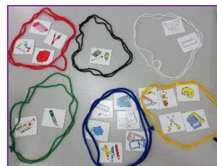
おかたづけキッズパズル