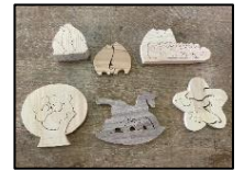
《ぷちフェスタ フリーマーケット 木エパズル》