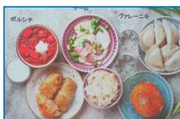
ウクライナの食文化