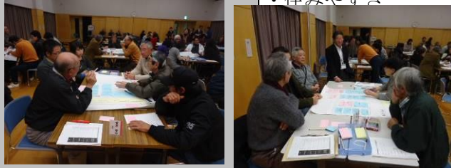
「自然・街並み・環境・歴史」は2つのグループに分かれて話し合いました。