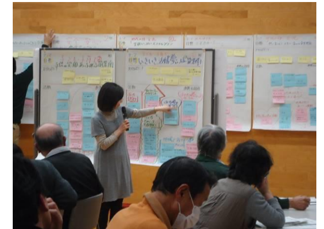
第4回学習会 参加者アンケートの結果（抜粋）