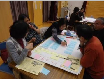
「子ども・子育て」は2つのグループに分かれて話し合いました。