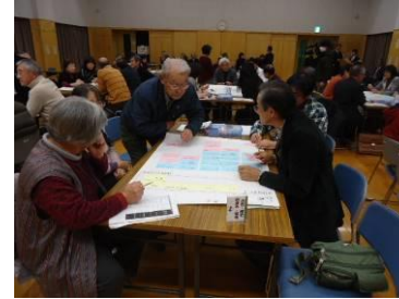
「安全・安心」は2つのグループに分かれて話し合いました。