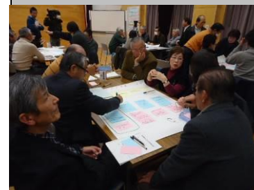
「高齢者支援」は2つのグループに分かれて話し合いました。