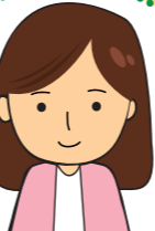
認知症地域支援推進員

Bさんへ 「お住まいの〇〇地区な ら、公民館で体操教室が 開催されていますよ。ほ かには…」