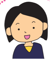
主任ケアマネジャー

Aさんへ 「介護保険は介護が必要なご状態 になられた時に使えます。 手続きに関しては…」