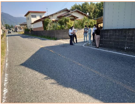
阿志岐小学校 [対策検討メンバー] 学校・教育委員会・道路管理者