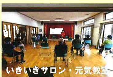
いきいきサロン・元気教室