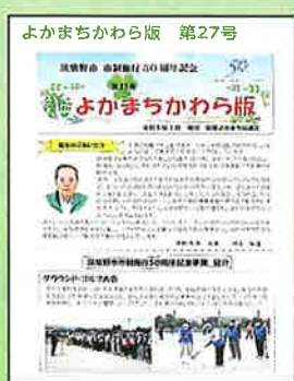
広報誌 年4回発行しています