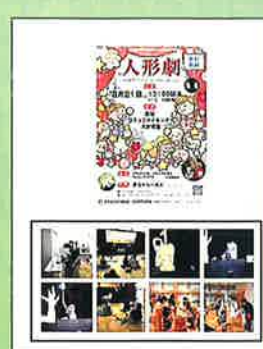
次世代育成部会 「人形劇団つくんぼ」 によるイベントの様子