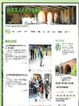
バナーは 国の登録有形文化財の 九州鉄道城山三連橋梁です