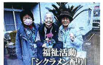
福祉活動 「シクラメン配り」