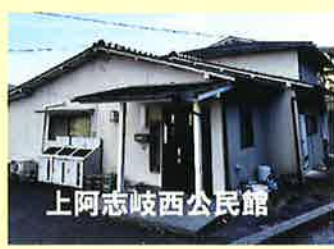
上阿志岐西公民館