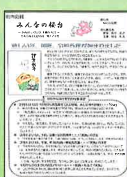
各行政区 現在、桜台・岡田・永岡区の 広報誌を掲載しています