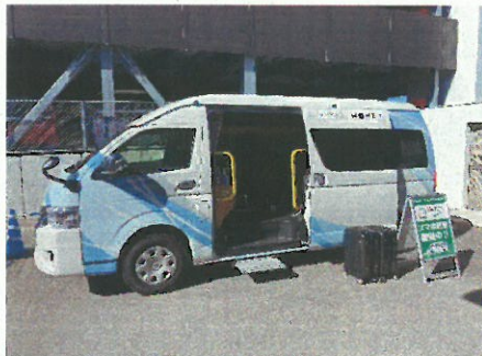
(スマサポ号の外観)