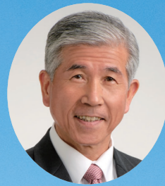
筑紫野市長 平井 一三