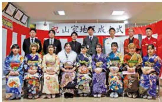
成人式に参加した若者たち