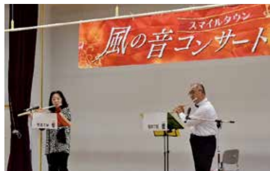
冬の澄んだ空気の中、美しい音色が響きました