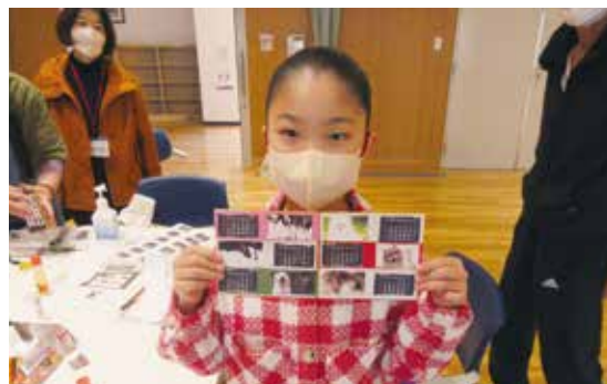
不思議な「カラクリ」カレンダーを披露する子どもたち