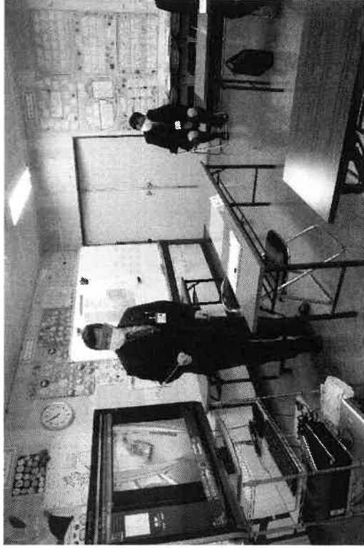
(調理の流れ等説明、質疑、応答)