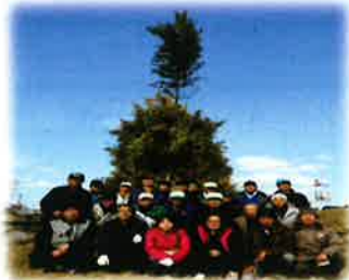
ほうげんぎょう(1月)