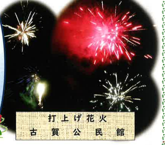
打上げ花火 古賀公民館