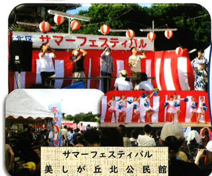
サマーフェスティバル 美しが丘北公民館