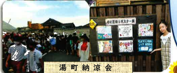
湯町納涼会 湯町公民館