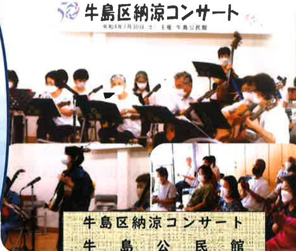
牛島区納涼コンサート 令和4年7月30日 主催 牛島公民館