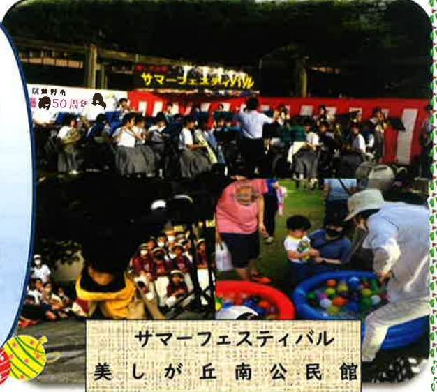
サマーフェスティバル 美しが丘南公民館