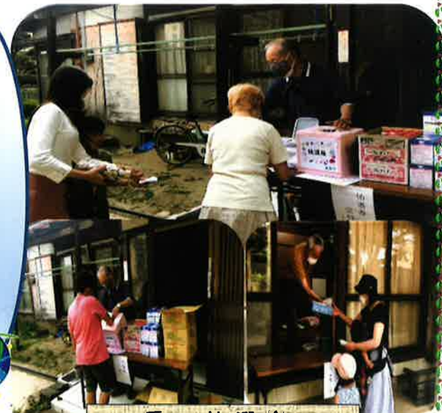
夏の抽選会 石崎公民館