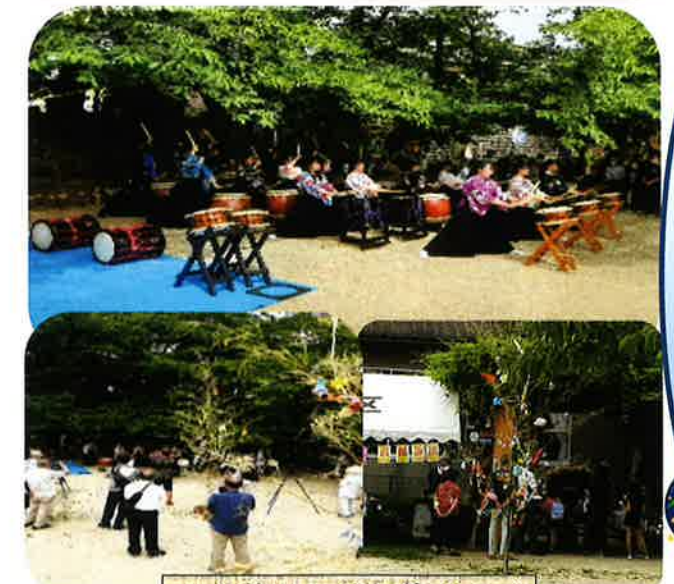
七夕飾りと竹灯籠のタベ 紫ヶ丘公民館