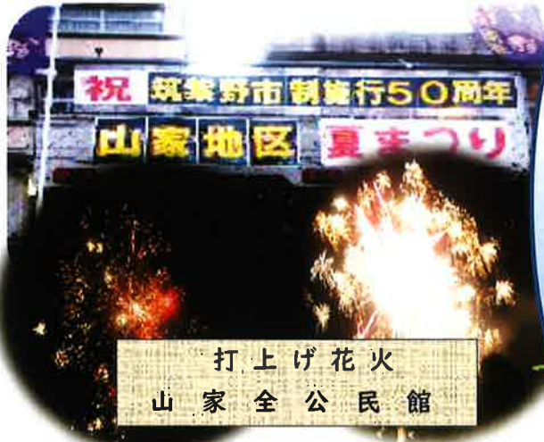
打上げ花火 山家全公民館