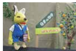
人形劇団むくむく 「こんたのおつかい」