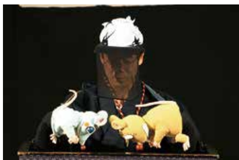
人形芝居 燕屋「ねずみのすもう」