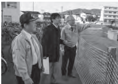
説明を受ける九州地方整備局長(中央)と藤田市長