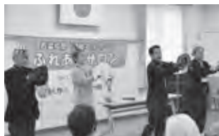
▲ボランティア訪問活動