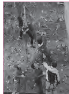
平成28年度「スポーツ クライミング教室」のようす