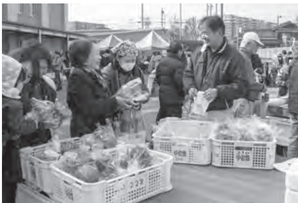
地元農家の皆さんによる新鮮野菜の販売は大盛況

地元農家の新鮮野菜や手づくりの手芸品、フリーマーケットなどが出店した「ふれあい市」が開催されました。初めての開催となった会場内では、会話を楽しみながら商品を買って定めたり、ふるまわれた綿菓子・豚汁をおいしそうに味わったりといった笑顔の姿がたくさん見られました。小さな子どもを連れた家族も多く、「綿菓子をもって子どもたちも楽しそうにしています」「野菜いっぱい買いました」という声が聞かれました。