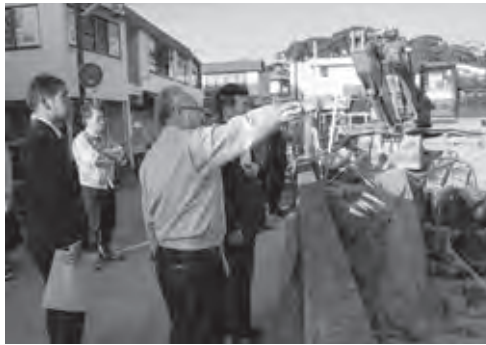
水道橋の架け替え工事を視察

西鉄紫駅付近から西鉄二日市駅市営駐輪場付近までの約1キロメートルの区間、高尾川の川底から約10メートル下に内径5メートルの地下河川を新たに築造します。大雨などであふれた水はこの地下河川に流れ込み、下流で再び合流します。平成27年度～31年度のおおむね5年間で福岡県那珂県土整備事務所が事業を行います。