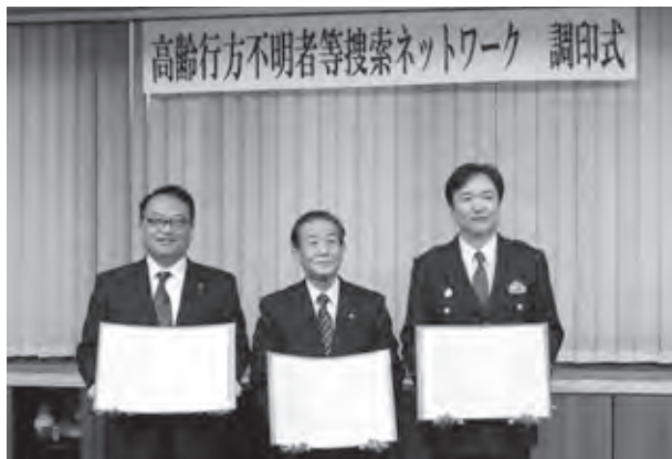
連携により、高齢者がより安全・安心に暮らせるまちを目指します

これは、認知症をはじめとする高齢者が行方不明となった際に、その早期発見・保護を目的として、筑紫野市、太宰府市と筑紫野警察署との間で相互に連携するものです。これまでも連携は行っていましたが、今回の協定を締結することにより、より強化し、安全・安心のまちづくりを行っていきます。