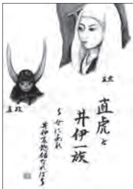
画・字：今長谷照子

広報ちくしの3月1日号でご案内したテーマ 「立花道雪」は、都合により変更(延期)になりま した。次回5月21日の「人物歴史講座」で取 り上げる予定です。ご了承ください。