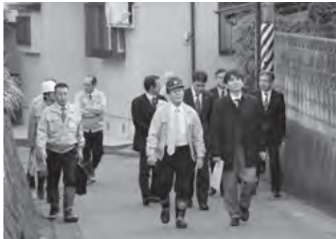
浸水被害のあった西鉄通り商店街を視察