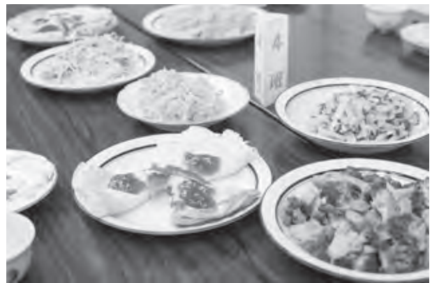
新鮮な地元産農産物を使った料理10品を作りました