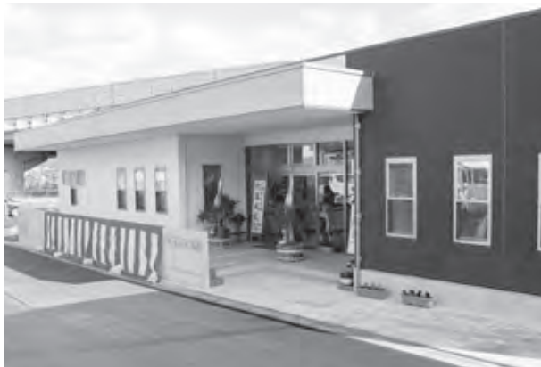
新たな装いで完成した杉塚公民館

新しい公民館は、誰もが利用しやすいように、部屋に靴を脱がずに入ることができるバリアフリーとなっています。これからは、住民のコミュニケーションの場、憩いの場として公民館活動が始まります。