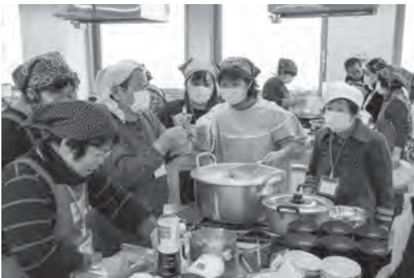
協力しながら、にぎやかに調理を行う皆さん

今回は、筑紫野産のブロッコリーや白ネギ、大根などの新鮮な野菜をふんだんに使った「がめ煮」や「ぬ