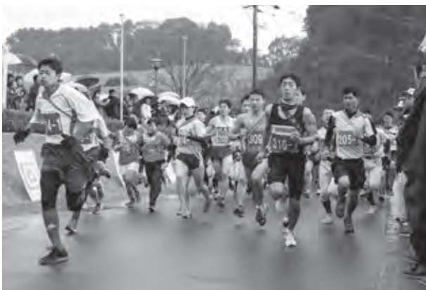
スタート、一斉に走り出す選手

時折雪が降り、厳しい寒さの中、各チームが懸命の走りを見せ、たすきをつないでいました。一般の部では筑紫野太宰府消防本部A、高校の部では筑紫高校、中学の部では二日市中学校陸上競技部、女子の部では九州産業高校駅伝部が好記録で優勝しました。