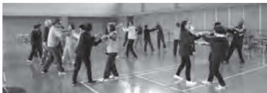
交流会でのレクリエーションのようす