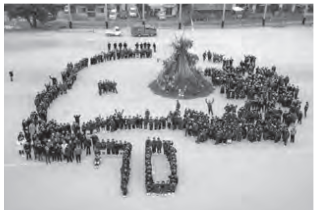
筑山中学校は創立70周年を迎えました

大会後には、空高く竹で組まれたやぐらに火がつけられ、一気に燃え上がった火で体を温めると生徒の皆さんは笑顔を見せていました。