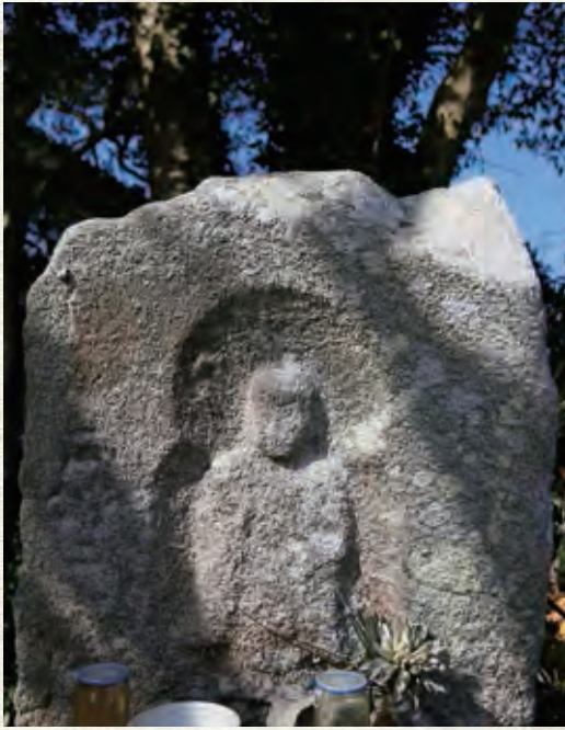
今日も静かにたたずむ石仏

南北朝が統一されて世の中心が落ち着いたのは、合戦後50年近くの年月が過ぎてからのことでした。