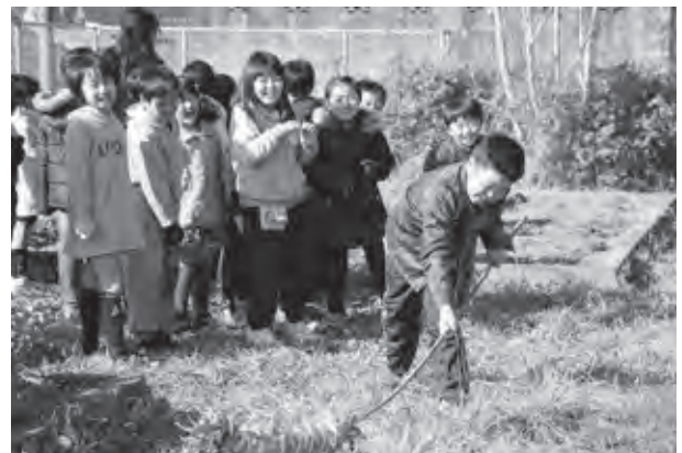
一人一人が元気いっぱい地面を打ちました

吉木小学校で3年生が「もぐら打ち」をしました。「もぐら打ち」は、農作物を荒らすもぐらを追い払い、五穀豊穡を願って吉木地区で年始に行われている伝統行事です。コミュニティ・スクールの一環で地域の皆さんに教えてもらいながら、子どもたちは「十四日のもぐら打ち〜！」と元気に声を掛け、竹の先にわらを巻いた道具で野菜などを大切に育てている学級園の地面を打っていました。「楽しかった」「育てている作物を守れてよかった」と感想がありました。