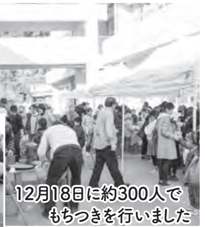
12月18日に約300人でもちつきを行いました