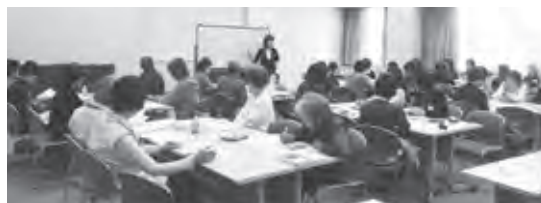
↑ 昨年の研修会のようす

①講座名(「日本語ボランティアスキルアップ研修会」)、②郵便番号、③住所、④氏名(ふりがな)、⑤電話番号、⑥日本語ボランティア経験の有無を明記してください。