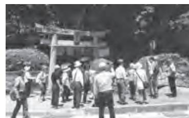
【長崎街道旅物語 館外学習のようす】