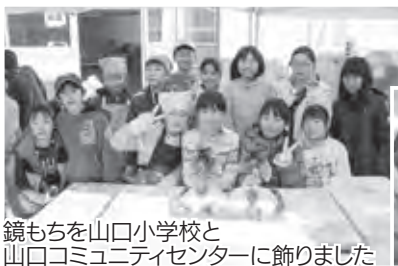
鏡もちを山口小学校と山口コミュニティセンターに飾りました