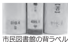
市民図書館の背ラベル

本であるといえます。 日本十進分類は本を内容によって分類するもので、同じ分類番号の本は、同じジャンルの本であるといえます。