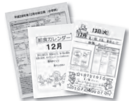
献立表と給食カレンダー

その特徴を書いた給食カレンダーが届きます。それを活用して、その日の給食がどのような献立か、食べる前に当番の児童が発表することにより、給食に対して関心を持つようになっています。