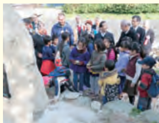
台座に石を据える子どもたち