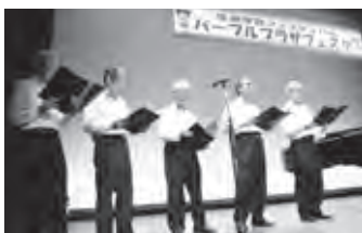
【平成28年10月 パープルプラザフェスタ での活動発表のようす】