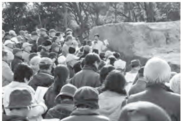
発見された土塁の前で市担当者の説明を聞く皆さん

この土塁は、7世紀後半に築造された古代の山城と同様に「版築(はんちく)」と呼ばれる異なる種類の土を層状に積み重ねる工法でつくられおり、九州の政治の中心地であった大宰府を防御する目的で築かれたものと考えられます。