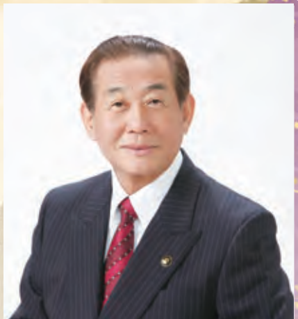
筑紫野市長 藤田陽三