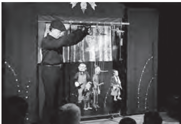
系あやつり人形劇団みのむしさんによるマリオネットの実演