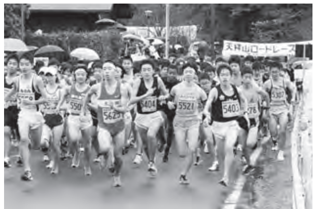
5kmの部、一斉にスタートする選手

大会には、小学生から高齢者まで950人の選手がエントリーし、雨天というコンディションでしたが、選手たちは自己ベストを目指し、思い思いに走りました。近隣の駅伝強豪校の参加もあり、ハイレベルな走りを見ることができました。