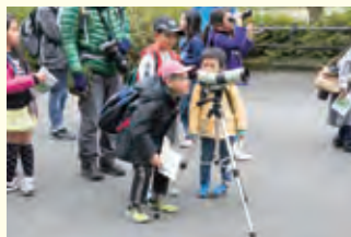
野鳥を探しながら散策しました