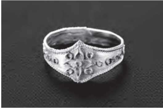
国宝 金製指輪 福岡県宗像市沖ノ島7号遺跡出土(宗像大社)