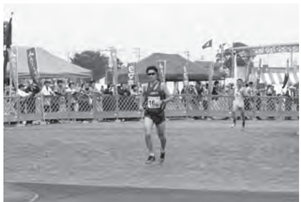
前々回3位、前回5位、今回4位と常に上位の筑紫野市チーム

筑紫野市チームは、選手一人ひとりが存分に力を発揮し、北九州市、福岡市、久留米市に続く、4位入賞を果たすことができました。選手たちの頑張りが、筑紫野市の名前を県下に轟かせてくれました。