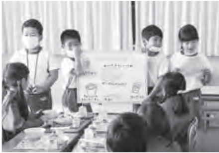
今日の献立と、その特徴を発表します