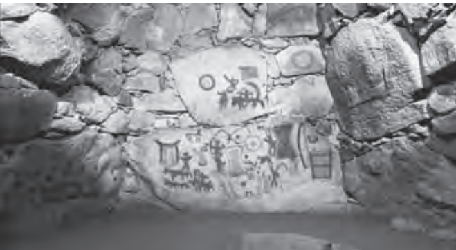
壁画はCGにより加工したもの