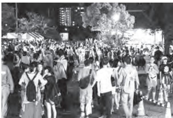
雨の中でも多くの皆さんが来場しました

祭りの最後を飾る花火については、雨が小康状態となる時間に早めることで打ち上げることができました。