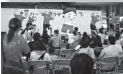
↑ 昨年のフェスタでお披露目♪