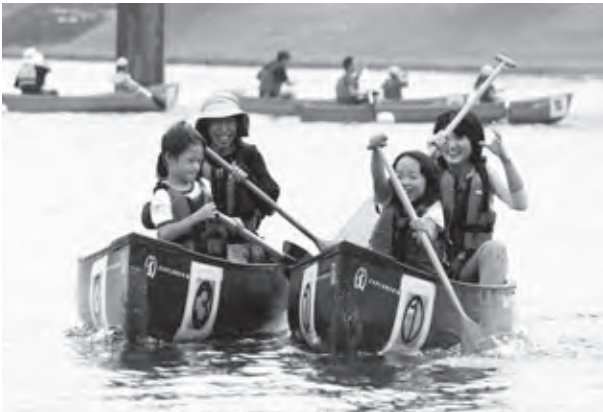
二人乗りカヌータイムレース(子どもと大人の部)

大会最後に行われた5人乗りの地区対抗カヌーレースの決勝では、予選で上位となった8組が一斉にスタートし、白熱したレースを展開していました。