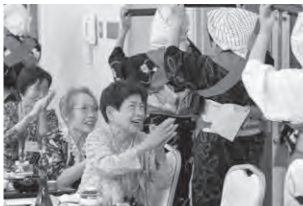
「そろばん踊り」など、とても盛り上がりました

参加した人は「大坪町の敬老会は、子どもたちが参加してお祝いしてくれる。それを毎年楽しみにして参加しています」と話してくれました。