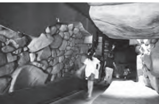
古墳館では模型の内部を見学できます