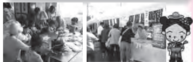
昨年のフェスタのようす(体験学習・バザー)