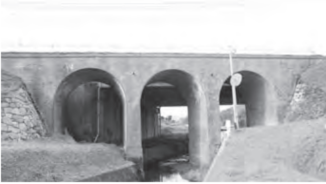
旧九州鉄道城山三連橋りょう

また、各講座終了後に学芸員による 展示解説を開催します。企画展見学の 見所などを楽しくお伝えします。