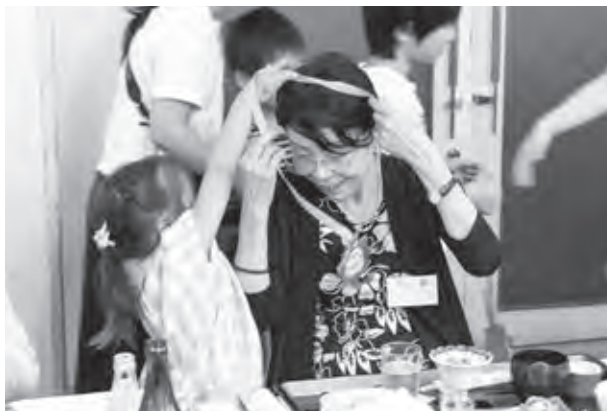
子どもたちから贈り物がありました

大坪町では、ゲストなどを呼ぶことなく町内の皆さんによる運営、出演などにより敬老会が行われており、中には敬老会の出席者でいくつもの出演もこなす人もいます。