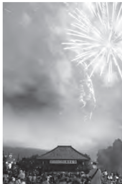
花火を楽しむことができました

残念ながら月を望むことはできませんでしたが、最後までご参加いただいた皆さん、関係機関・団体の皆さん、ありがとうございました。