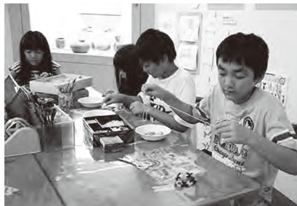
ストローを使ってアクセサリーを作りました

ビデオや石室を見学して学習した後、石室に描かれていた壁画などを絵の具を使って石に描く体験や、ストローを使って管玉のアクセサリー作りの体験を行いました。子どもたちは、工夫している色々な色や形の絵を描いたり、アクセサリーを作り上げていました。