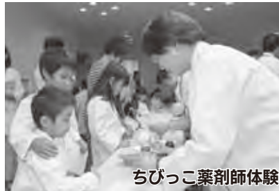
ちびっこ薬剤師体験