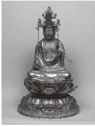
柚須原の木造聖観音坐像