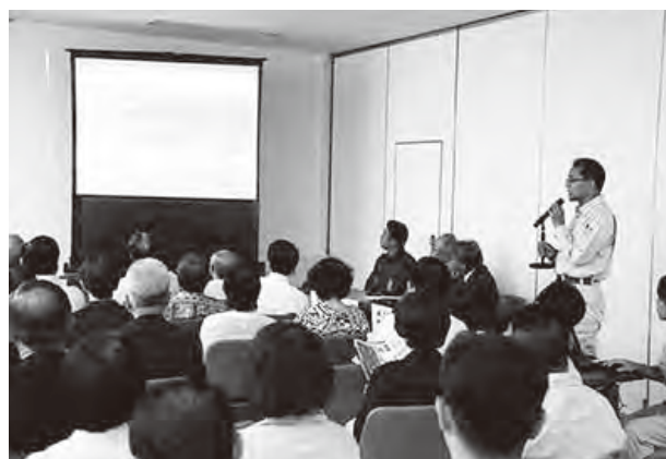
福岡県那珂県土整備事務所による河川改修事業の説明

集会では、高尾川・鷺田川改修促進期成会の皆さん、市議会、市職員が参加し、河川改修について福岡県那珂県土整備事務所から詳しい説明を受けました。