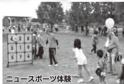
ニュースポーツ体験