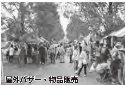
屋外バザー・物品販売