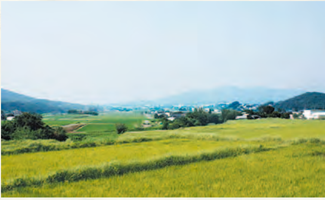
大石から見た御笠の景色

奈良時代から平安時代にかけて、九州全体を管轄し、外交の玄関口でもあった大宰府には、都から多くの官人が赴任していました。官人たちは大宰府で職