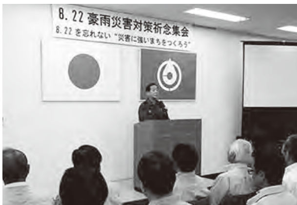
市職員全員の防災意識の強化を図りました